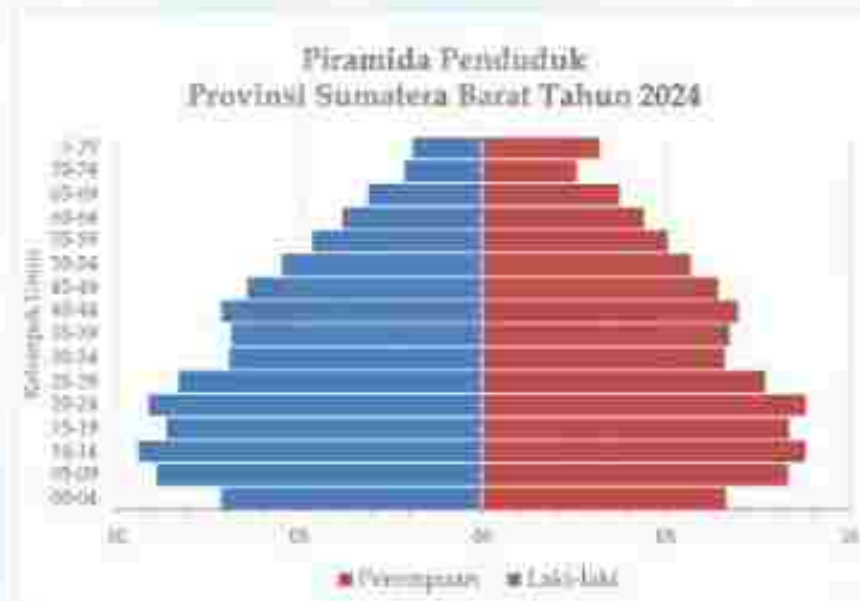
Gambar 2. Piramida Penduduk Provinsi Sumatera Barat Tahun 2024

Piramida penduduk Provinsi Sumatera Barat Per 31 Desember 2024 dapat dilihat pada Gambar 2 di bawah ini :