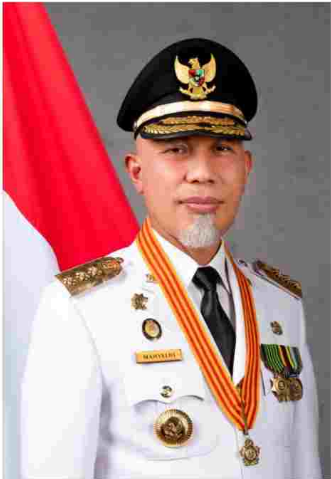
MAHYELDI GUBERNUR SUMATERA BARAT